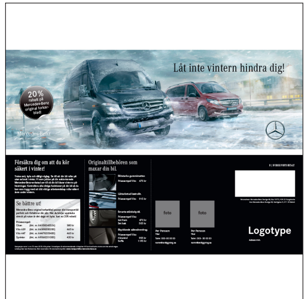
Vykort fram + 2 alternativa baksidor